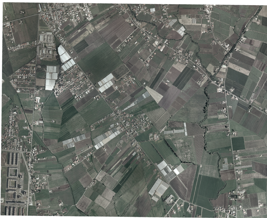
ORTOFOTO Scala 1 : 25000

Voto del 2002 di proprietà della Regione Lazio Restituzione del 2005